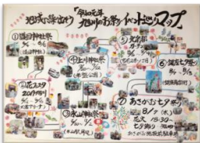
旭川市内のお祭りへ参加