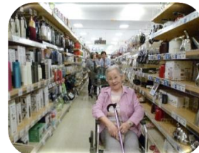
外出行事(ショッピング)