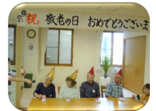
敬老会(ご長寿クイズ)