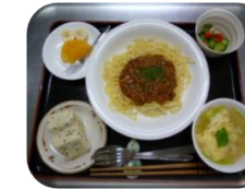
ミートスパゲティ