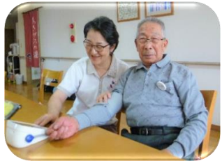
バイタルチェックの様子