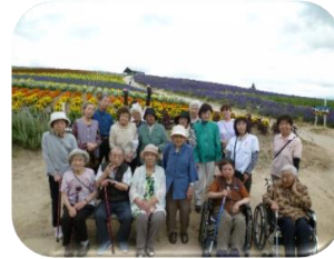
外出行事(ドライブ)