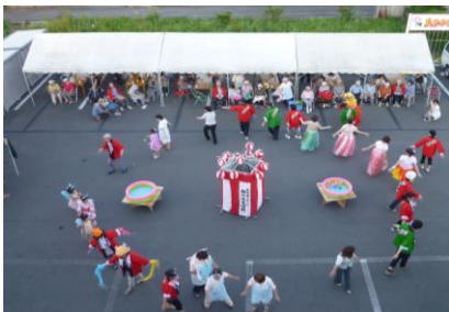
あさがお地域交流夏祭り