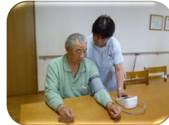
バイタルチェックの様子