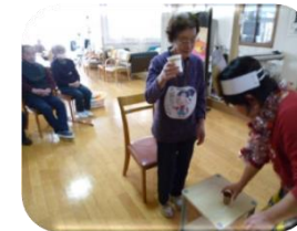
レクリエーション