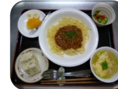
ミートスパゲティ