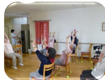
機能訓練・転倒予防体操