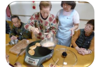
お誕生会(桜餅づくり)